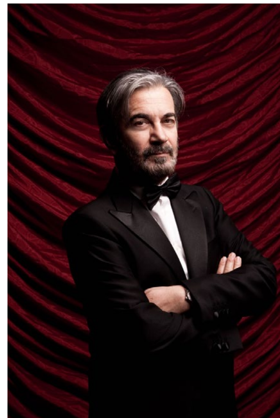
Immagine pubblica e identità segreta oggi più che mai entrano in rotta di collisione, manipolate e falsificate. Esiste qualcosa di più moderno del racconto di Wilde?

LA BELLEZZA È SUPERIORE AL GENIO PERCHÉ NON HA BISOGNO DI SPIEGAZIONI